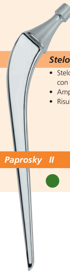
Stelo lungo Centris®